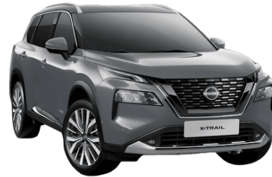
Gyöngyházzsürke KBY – 250 000 Ft