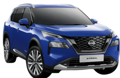
Kék RBV – 210 000 Ft