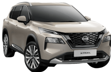
Pezsgő ezüst KAY – 250 000 Ft