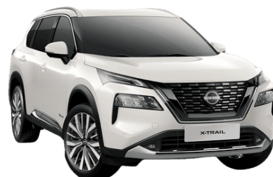
Gyöngyházfehér QBE – 250 000 Ft