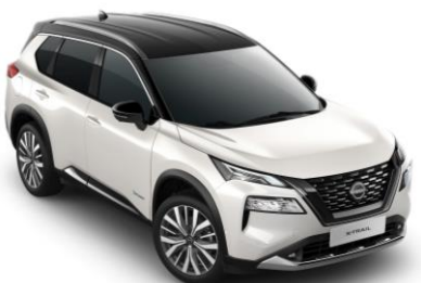
Gyöngyházfehér - Fekete XKJ – 450 000 Ft