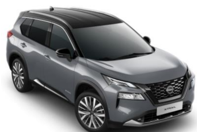
Gyöngyházzsürke - Fekete XEX – 450 000 Ft