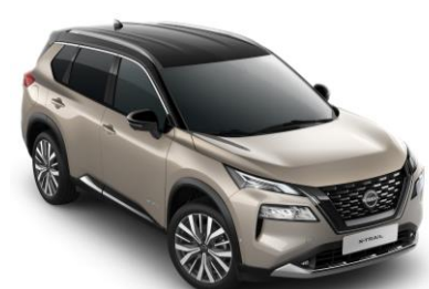
Pezsgő ezüst - Fekete XEW – 450 000 Ft