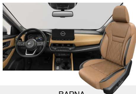
BARNA NAPPABŐR ÜLÉSEK [C]