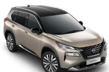
Pezsgő ezüst - Fekete XEW – 450 000 Ft