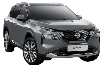
Gyöngyházzsürke KBY – 250 000 Ft