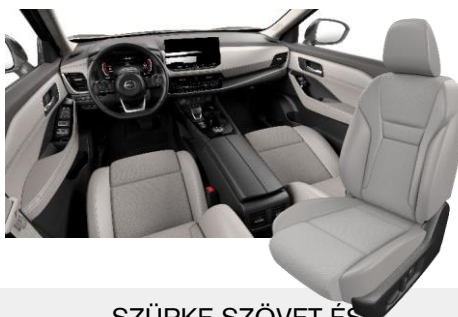
SZÜRKE SZÖVET ÉS SZINTETIKUS BŐRÜLÉSEK [K]