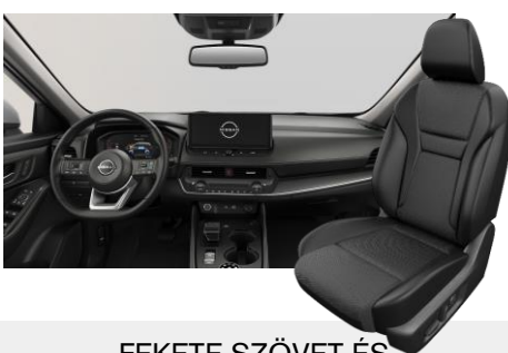
FEKETE SZÖVET ÉS SZINTETIKUS BŐRÜLÉSEK [G]