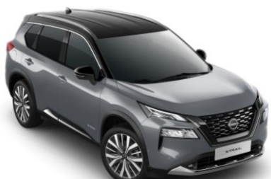
Gyöngyházzsürke - Fekete XEX – 450 000 Ft