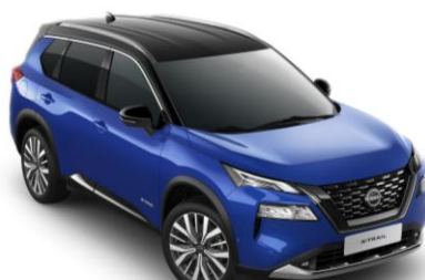
Kék - Fekete XEU – 410 000 Ft