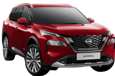
Sötétvörös NBL – 250 000 Ft