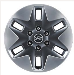
18" könnyűfém keréktárcsák (Comfort Plus 9 személyes)