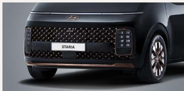
Luxury 7 személyes