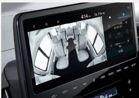
Audióvizuális kapcsolattartás a hátsó utasokkal