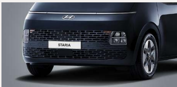
Comfort 9 személyes