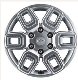
17" könnyűfém keréktárcsák (Comfort 9 személyes)