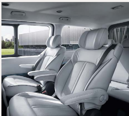
Luxury 7 személyes