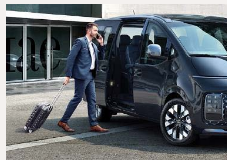
Elektromosan csúsztható ajtók