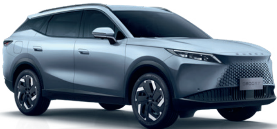
HOLDFÉNY EZÜST (KU)