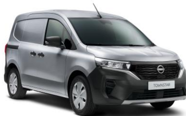
Gyöngyház szürke KQA – 130.000 Ft*