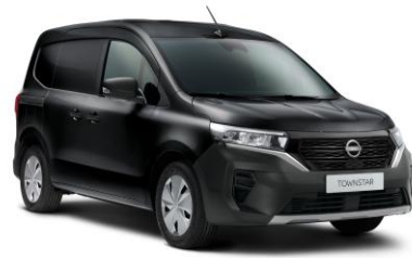
Enigma fekete GNE – 130.000 Ft*