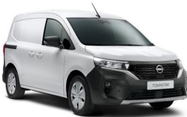
Fehér QNG – 0 Ft*