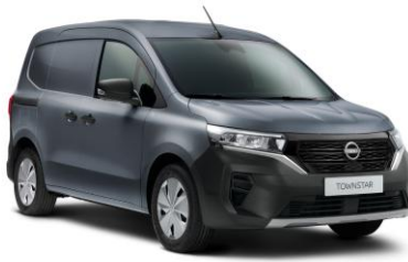
Szürke KPW – 70.000 Ft*