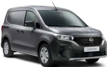
Casiopee Szürke KNG – 130.000 Ft*