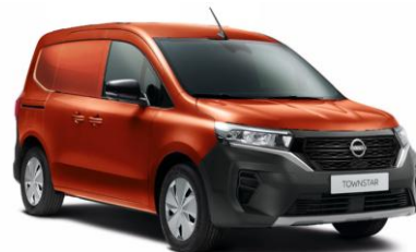
Terrakotta CNZ – 130.000 Ft*

*- a megjelenített árak ÁFA nélkül értendők