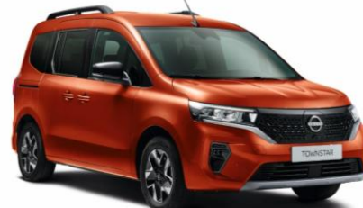
Terrakotta CNZ – 165.100 Ft