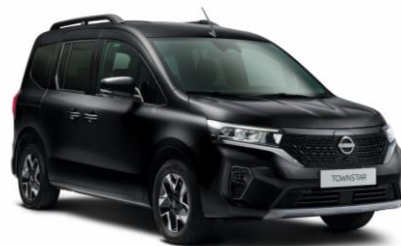
Enigma fekete GNE – 165.100 Ft