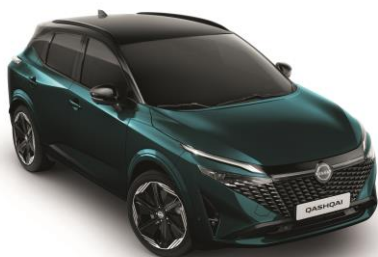
Mélyóceán & Fekete YBJ – 500 000 Ft