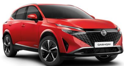
Naplementevörös NBV – 240 000 Ft