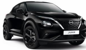
Gyöngyházfekete GAT - 160 000 Ft