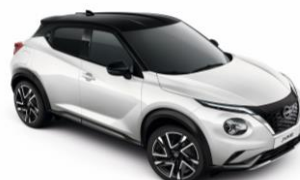
Fehér / Fekete XKJ - 300 000 Ft