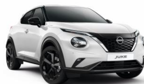
Gyöngyházfehér QBE - 190 000 Ft