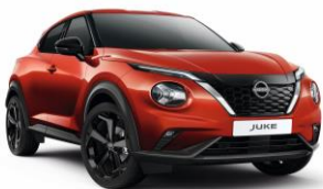
Naplemente vörös NBV - 0 Ft