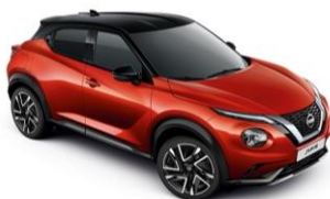
Piros / Fekete YAU - 300 000 Ft