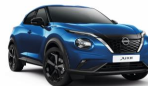
Élénkkek RCF - 160 000 Ft