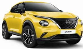
Sárga ECE - 160 000 Ft