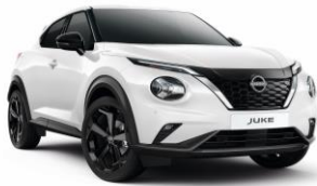
Fehér 326 - 70 000 Ft