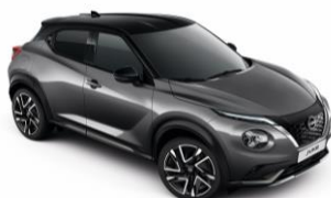
Szürke / Fekete GAQ - 300 000 Ft