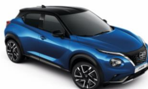
Élénkkek / Fekete XGZ - 300 000 Ft