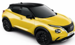
Sárga / Fekete YAS - 300 000 Ft