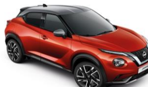
Piros / Ezüst XEZ – 300 000 Ft