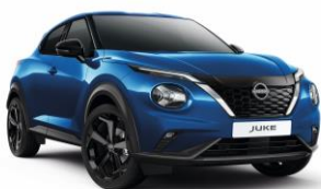
Élénkkek RCF – 160 000 Ft