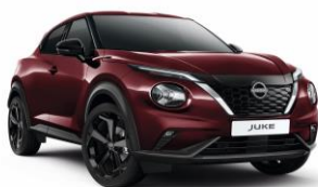
Burgundi NBQ – 160 000 Ft