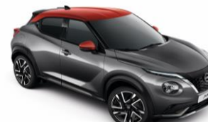
Szürke / Piros XFB – 300 000 Ft