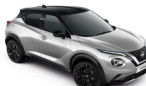
Ezüst / Fekete YAV – 300 000 Ft