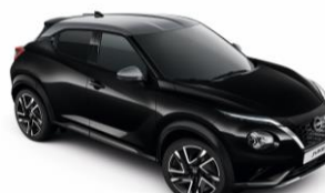
Fekete / Ezüst YAY – 300 000 Ft