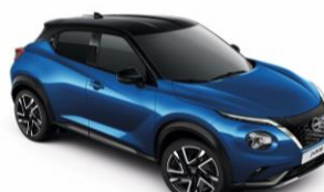
Élénkkek / Fekete XGZ – 300 000 Ft