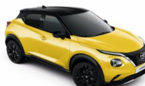
Sárga / Fekete YAS – 300 000 Ft