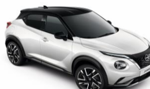
Fehér / Fekete XKJ – 300 000 Ft