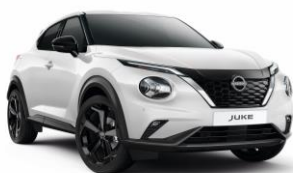
Gyöngyházfehér QBE – 190 000 Ft