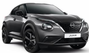
Szürke KAD – 160 000 Ft