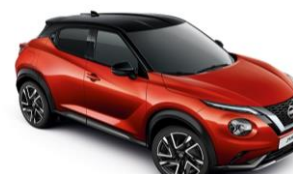
Piros / Fekete YAU – 300 000 Ft