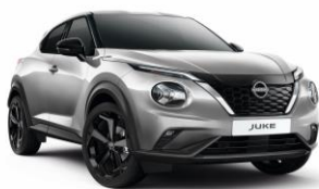
Ezüst KYO – 160 000 Ft