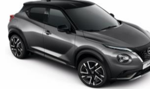
Szürke / Fekete GAQ – 300 000 Ft