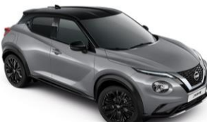
Szürke / Fekete XEX – 300 000 Ft