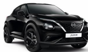
Gyöngyházfekete GAT – 160 000 Ft