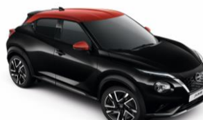
Fekete / Piros YAX – 300 000 Ft