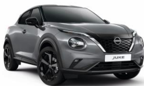
Gyöngyházsürke KBY – 160 000 Ft