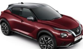
Burgundi / Ezüst XEE – 300 000 Ft