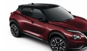
Burgundi / Fekete XDO – 300 000 Ft