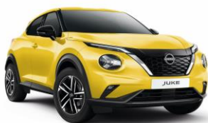
Sárga ECE – 160 000 Ft