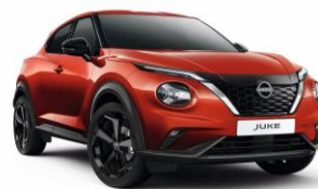
Naplemente vörös NBV – 160 000 Ft