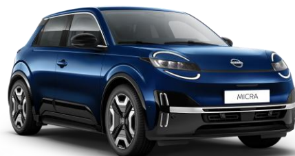
Tengeréskék RRE – 160 000 Ft