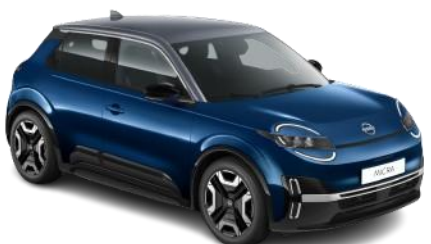
Tengeréskék / Szürke tető YWZ – 300 000 Ft

*ENGAGE felszereltség a csillaggal megjelölt színekben érhető el.