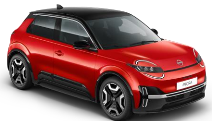
Lázadóvörös / Fekete tető YZA – 300 000 Ft