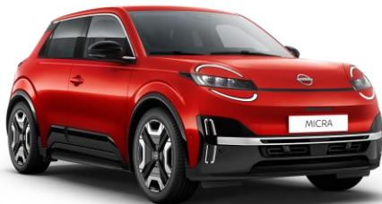
Lázadóvörös NPT – 160 000 Ft