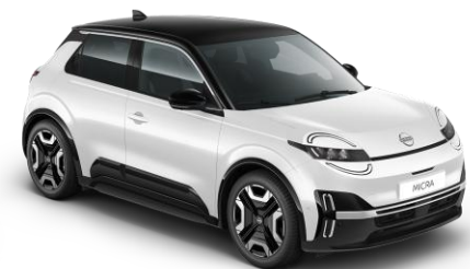
Hófehér / Fekete tető XUF – 300 000 Ft