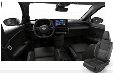
Komfort belső Szövet ülések