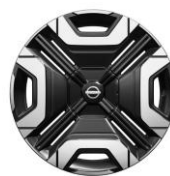
18" Iconic könnyűfém keréktárcsa