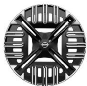
18" Acél keréktárcsa díztárcsával