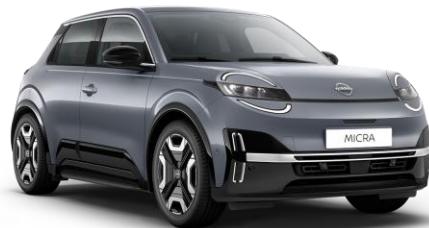
Elegánszüst* KQG – 160 000 Ft