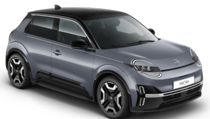
Elegánszüst / Fekete tető YUY – 300 000 Ft