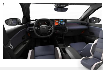
Sport belső Szintetikus bőr ülések