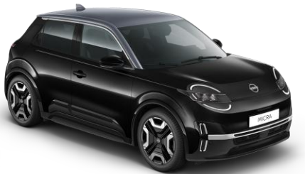
Misztikusfekete / Szürke tető YWX – 300 000 Ft