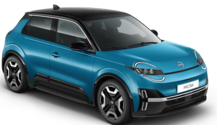
Boldogságbék / Fekete tető YZF – 300 000 Ft