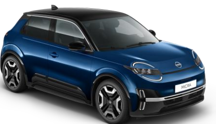
Tengeréskék / Fekete tető YWW – 300 000 Ft