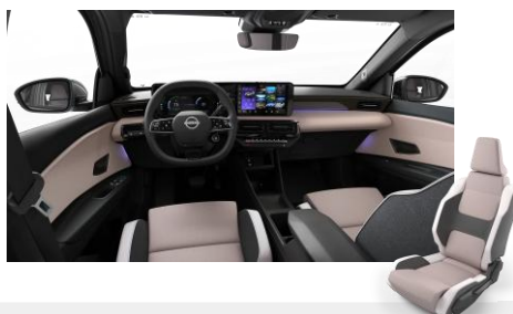
Zen belső Szövet és szintetikus bőr ülések