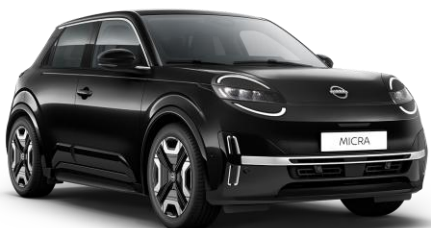
Misztikusfekete* GNE – 160 000 Ft