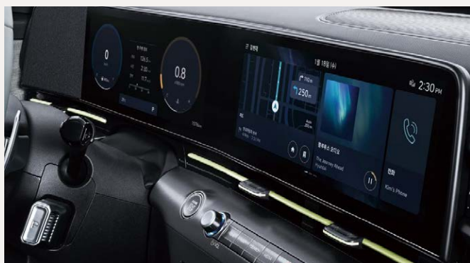
Dupla 12,3"-os kijelző