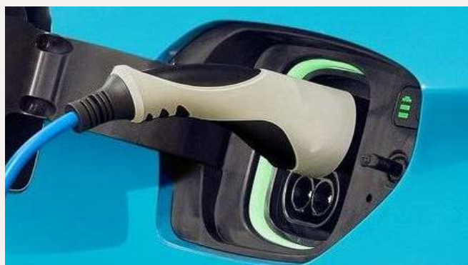
Fűthető elektromos töltőnyílás