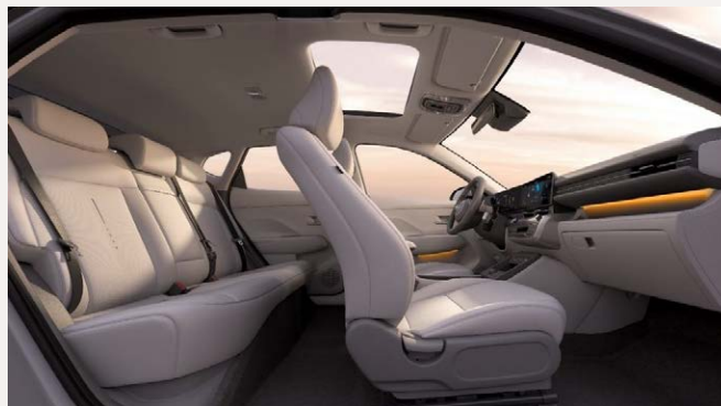
Vékony ülések és tágas belső tér