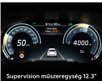
Supervision műszeregység 12.3"