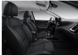
Választható műbőr/textil kárpitozás X-GOLD és X-PLATINUM felszereltséghez (CPB)