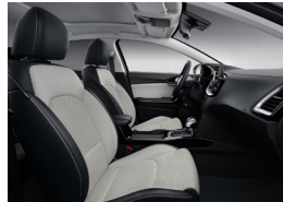
Választható műbőr/textil kárpitozás X-GOLD és X-PLATINUM felszereltséghez (CPA)