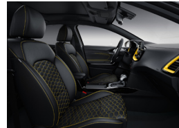
Opcionális YELLOW csomag műbőr/textil kárpitozással X-PLATINUM felszereltséghez (CPE)