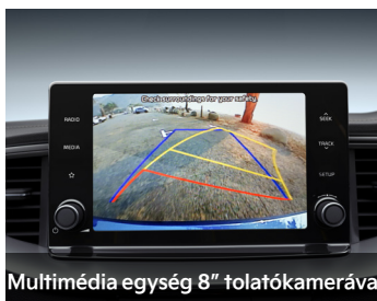
Multimédia egység 8" tolatókamerával