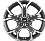
18" könnyűfém keréktárcsa (X-GOLD, X-PLATINUM)