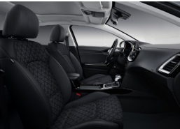
Textil kárpitozás X-BRONZE és X-SILVER felszereltségekhez