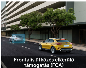
Frontális ütközés elkerülő támogatás (FCA)