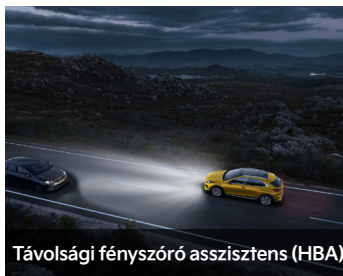
Távolsági fényszóró asszisztens (HBA)