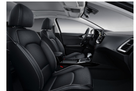
Opcionális BŐR csomag bőr kárpitozással X-PLATINUM felszereltséghez