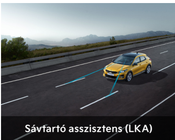
Sávfartó asszisztens (LKA)