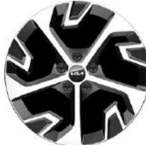
18" könnyűfém keréktárcsa Type A /XK/ (PLATINUM - ICE/HEV)