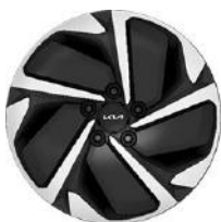
17" könnyűfém keréktárcsa Type B /VB/ (GOLD - ICE/HEV)