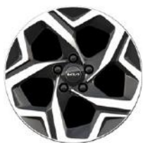
17" könnyűfém keréktárcsa Type A /VA/ (SILVER)