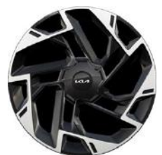
19" könnyűfém keréktárcsa Type A /XM/ (GT-LINE - ICE/PHEV)