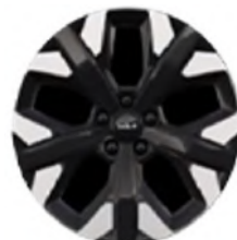
19" könnyűfém keréktárcsa Type B /XP/ (GOLD, PLATINUM - PHEV)