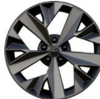
18" könnyűfém keréktárcsa Type B /XL/ (GT-LINE - HEV)