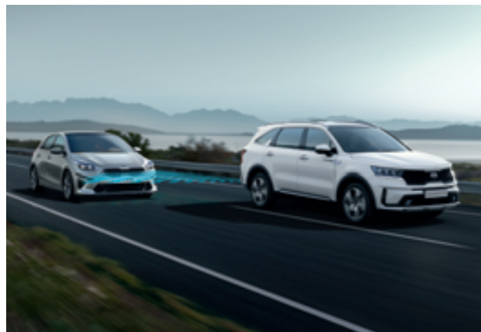
HOLTTÉRFIGYELŐ RENDSZER AKTÍVFÉKEZÉS-FUNKCIÓVAL (BCA)

Nincs, aki előre megmondaná, hogy milyen meglepetéseket tartogat egy utazás, ezért az új Sorento ultra-modern menetbiztonsági és vezetést segítő eszközök teljes garmadáját sorakoztatja fel utasai védelmében.