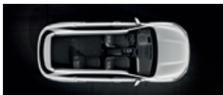
3. ülésor teljesen síkba döntve, 2. ülésor részben lehajtva