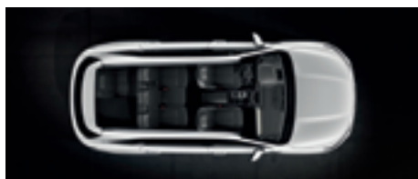
3. ülésor részben síkba döntve

Lehet öt- vagy hétszemélyes szabadidőautó, sőt akár hatalmas rakterű áruszállító is, hiszen a hátsó ülések lehajtásával 910 literesre bővíthető a csomagtartó befogadóképessége. A második sor síkba döntéséhez elég a poggyásztérben elhelyezett kapcsolókonzolt kezelnie - a bal és a jobb ülés egyaránt saját gombot kapott.