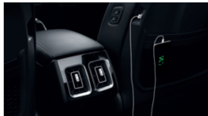
USB- ÉS TÖLTŐALJZAT MINDEN FELHASZNÁLÓNAK

Ismerje meg a világ egyik legjobb autóhifijét! A 12 hangszórós, külső erősítővel kiegészített, ultramodern Bose rendszer sztereó és többcsatornás forrásokkal egyaránt kompatibilis, és csodálatos, kristálytisza hangzás jellemzi.