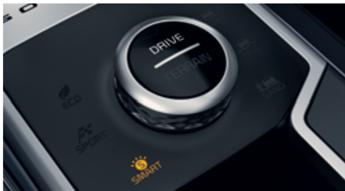
ÜZEMMÓDVÁLTÓ KAPCSOLÓ (DMS)

A jó fogású kormánykerék mögé kifinomult, krómozott kapcsolók kerültek, amikkel anélkül válthat sebességfokozatot a vezető, hogy elengedné a volánt. Használatukkal még dinamikusabban vezethető az autó, és könnyűszerrel kiaknázható a motorban szunnyadó forgatónyomaték.