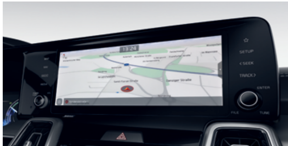
10,25 COLOS KÉPERNYŐ A NAVIGÁCIÓS RENDSZERHEZ

Az új Kia Sorento utasterében a legmodernebb fedélzeti rendszerekkel ismerkedhet meg. Ezek biztos mobilkommunikációs kapcsolatot és felhőtlen szórakozást ígérnek, s mivel pofonegyszerűen kezelhetők, a kényelemhez, az ergonómiához és a menetkomforthoz is nagyban hozzájárulnak.