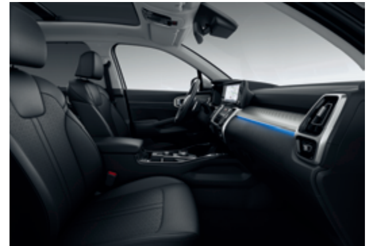
OPCIÓS, FEKETE BŐR