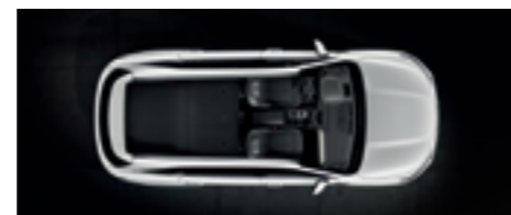
2. ülésor teljesen síkba döntve (ötüléses változat)

Mindegy, hogy mik a tervei vagy mit szeretne szállítani, a Sorento igazodik az Ön elvárásaihoz.