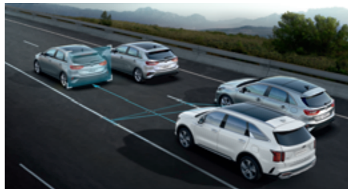
SÁVKÖVETŐ RENDSZER (LFA)

A DAW a kormánykerék-, az irányjelző- és a gázpedál-használat módját elemzi, és figyelmezteti a vezetőt, ha ébersége lankad. Például „jelez”, ha a sofőr nem reagál egy veszélyhelyzetre, és kávéscsésze formájú műszerfali ikonnal biztat pihenésre, ha úgy érzékeli, hogy a vezető fáradt.