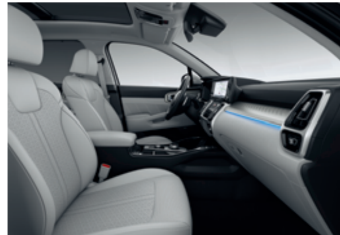
OPCIÓS, SZÜRKE BŐR