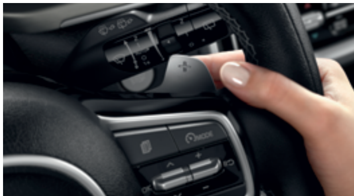
VÁLTÓFÜLEK A KORMÁNYKERÉKEN

Járja a maga útját a legfejlettebb motorok valamelyikével! A vadonatúj, öt- és hétüléses kivitelben elérhető Kia Sorento orrában villanymotorral társított, benzines 1.6 T-GDi erőforrás dolgozik, amelyhez első- és összkerek-hajtású hajtáslánc kapcsolódhat. A 2.2 CRDi szintén elérhető elsőkerék-hajtású és 4x4-es változatban is.