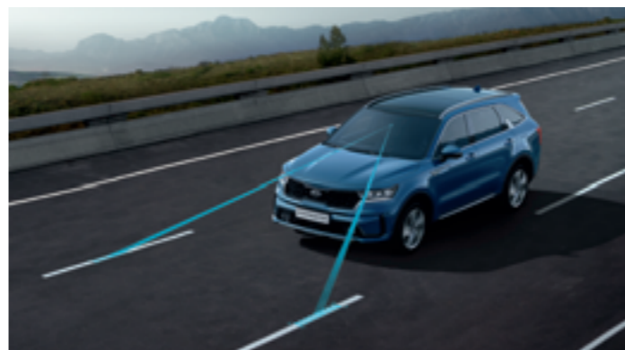
SÁVTARTÓ ASSZISZTENS (LKA)

A kameraadatokat elemző, 2. szintű LFA igen fontos lépés a részlegesen önvezető rendszerek felé. Az SCC-vel együttműködve képes a Sorento sebességét és irányát az előtte haladó autóhoz igazítani, ezáltal jelentősen kényelmesebbé és biztonságosabbá teszi a forgalmi dugók leküzdését. Mindemellett kamerákkal és radarokkal figyeli az útburkolati jeleket, és finom kormánymozdulatokkal a sáv közepén, biztonságos helyzetben tartja az autót. Működési sebességtartomány: 0-180 km/óra.