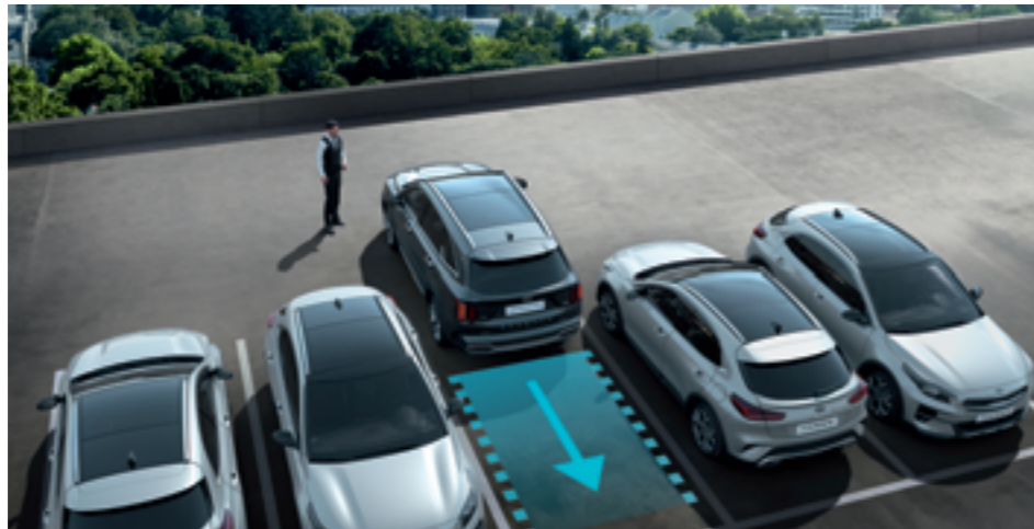
PARKOLÓSEGÉD TÁVIRÁNYÍTÁSSAL* (RSPA-ENTRY)

Az új Kia Sorento segít Önnek, hogy megfigyelhesse a jármű környezetét, fokozva ezzel a kényelmet, illetve a biztonságot a rövidebb és a hosszabb utazások során.