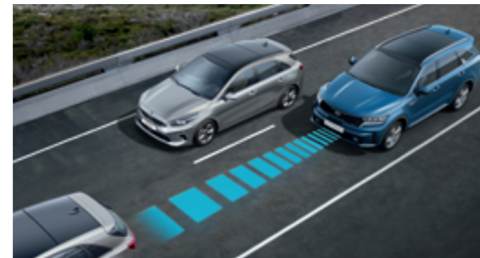
ADAPTÍV SEBESSÉGTARTÓ AUTOMATIKA STOP&GO-VAL (SCC W/S&G)

Az első kamera monitorozza az útburkolati jeleket, és ha azt érzékeli, hogy az autó a sáv szélé felé sodródik, akkor a vezérlőegység figyelmezteti a sofőrt, továbbá visszakormányozza a kocsit a sáv közepére.