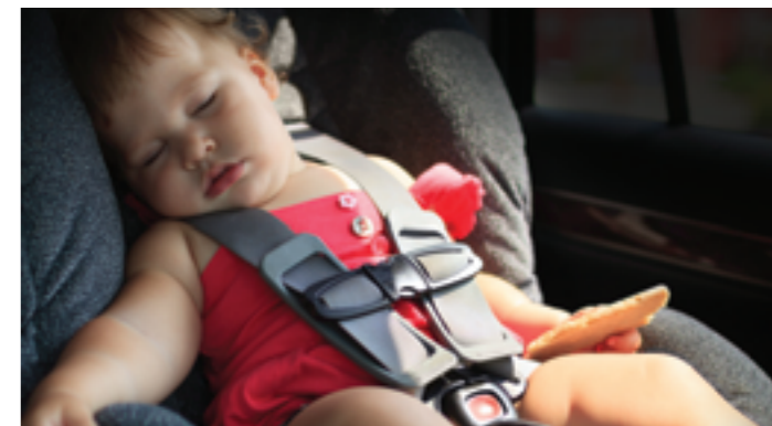
HÁTSÓ UTASRA FIGYELMEZTETÉS (ROA)

Ha a légszákó ütközés miatt kinyílnak, a rendszer automatikus üzenetet küld a menetstabilizálónak, hogy fékezze le az autót. Ezzel az MCBA képes megelőzni az esetleges további ütközéseket, vagy csökkenteni azok erejét.