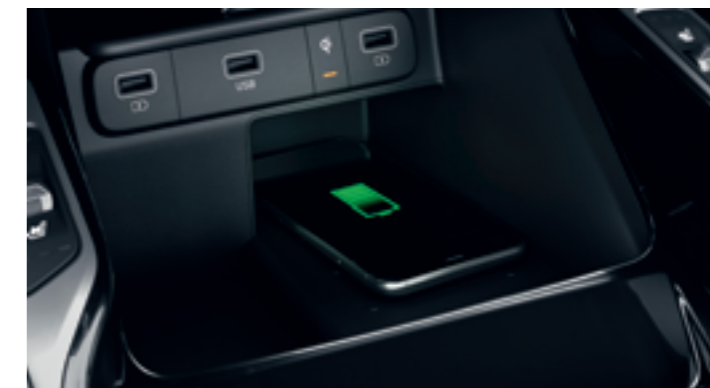
VEZETÉK NÉLKÜLI TELEFONTÖLTŐ

Hogy egyik utasnak se okozzon gondot a mobilkészülök töltése, a középkonzolon, az első ülések háttámláján és a csomagtartó két oldalán is található USB-aljzat, a műszerfalra pedig 12 voltos szivargyújtó-csatlakozó is került. A poggyásztérben elhelyezett két USB-port a harmadik ülésorban utazóknak lehet nagy segítség.