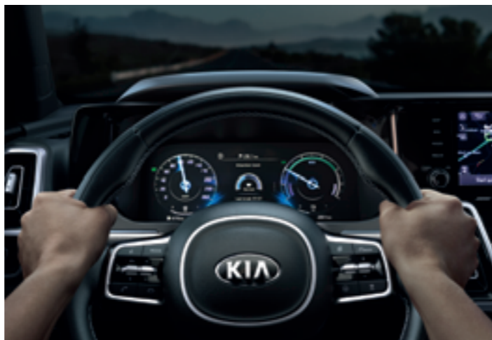
VEZETŐÉBERSÉG-FIGYELMEZTETŐ RENDSZER (DAW)

Ha a körülmények lehetővé teszik, a Sorento távolsági fényszórója automatikusan kapcsol fel és le. A szélvédő mögött elhelyezett kamera érzékeli a szemből érkező járműveket, és önműködően tompított világításra kapcsol, hogy ne vakítsa el a másik közlekedőt.