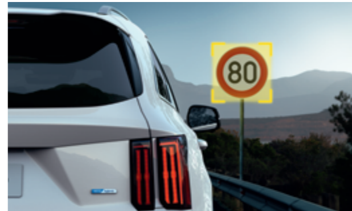
INTELLIGENS SEBESSÉGKORLÁTOZÁS-ASSZISZTENS (ISLA)

Ha az ISLA aktív, a beépített kamera figyeli a közúti jelzőtáblákat, a rögzített értékeket pedig megjeleníti a műszeregységen, valamint a navigációs rendszer képernyőjén. Ezt követően a vezető eldöntheti, hogy átlépi-e a sebességhatárt vagy sem.