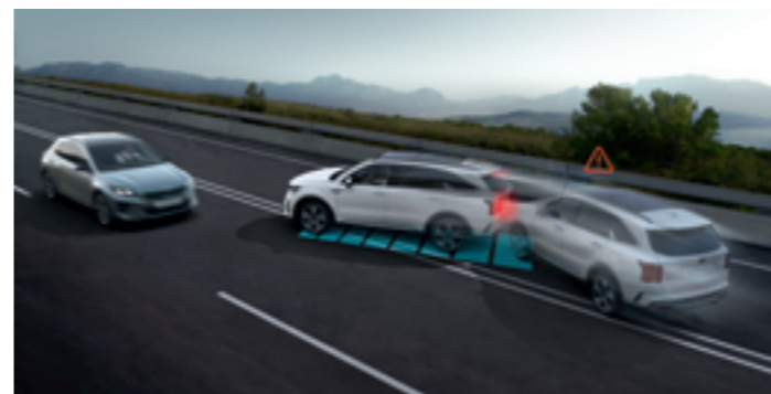
MÁSODLAGOSÜTKÖZÉS-ELKERÜLŐ ASSZISZTENS (MCB)

Ha a rendszer azt érzékeli, hogy bármi, például egy közeledő jármű veszélyezteti a kiszállni készülő utast, automatikusan lezárja az ajtókat, továbbá fény- és hangjelekkel figyelmezteti a felhasználót.