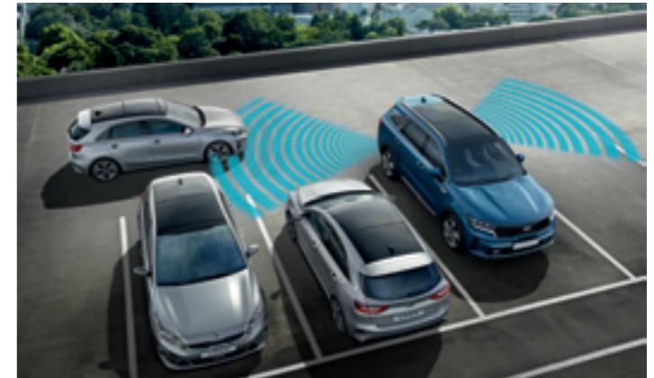
HÁTSÓ KERESZTIRÁNYÚ ÜTKÖZÉST ELKERÜLŐ ASSZISZTENS (RCCA)

A rendszer a hátul elhelyezett ultrahangos érzékelők és a tolatókamera adatait elemezve észreveszi, ha valaki vagy valami az autó mögött van be- és kiparkolás közben, illetve kis sebességnél. Veszély esetén vizuális és hangjelekkel figyelmezteti a vezetőt, sőt az ütközés elkerülése érdekében le is fékezi a kocsit.