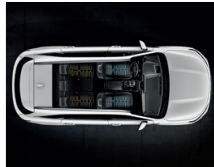
FŰTHETŐ ÉS SZELLŐZTETHETŐ ÜLÉSEK

Az integrált memóriaegység révén két vezető is elmentheti a számára ideális ülésbeállításokat, s hogy még nagyobb legyen a kényelem, a két első ülést deréktámasszal is kiegészítettük. Ugyancsak a komfortot szolgálja a vezetőülés változtatható méretű oldalsó párnázata. Az első, középső légzsák azt hivatott megakadályozni, hogy az elöl utazók feje egymásnak csapódjon egy esetleges ütközés során.