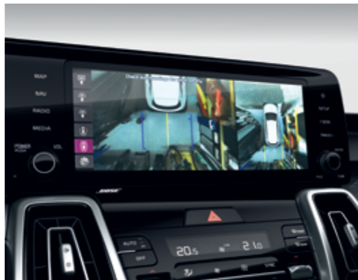
360° FOKOS KAMERARENDSZER

Egy percre sem kell levennie tekintetét az útról, a HUD (Head up display) ugyanis a vezető látómezejének közepén, a műszerfalon jeleníti meg a hatékony és biztonságos autózáshoz szükséges adatokat.