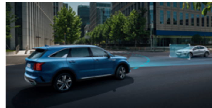
RÁFUTÁSOSÜTKÖZÉS-ELKERÜLŐ TÁMOGATÁS (FCA)

Ultrahangos szenzoraival a második és a harmadik sort figyel, s ha úgy érzékeli, hogy az ajtók bezárását követően gyermek vagy állat maradt a kocsiban, vizuális és hangjelekkel figyelmezteti a vezetőt.