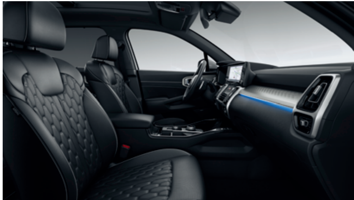
OPCIÓS, BLACK TŰZDELT/STEPPELT NAPPA BŐR SZÜRKE VARRÁSOKKAL ÉS DÍSZÍTÉSSEL

A Kia Sorento éppoly sokat elárul gazdája ízléséről, mint gondolkodásmódjáról. Ezért aztán a lehető legnagyobb szabadságot nyújtja az utastér összeállítására vonatkozólag, egyebek mellett nappabőr és textilkárpitozást kínál a vásárlóknak. Előbbit szálcsiszolt TOM-film kerettel és dombornyomású felülettel dobtuk fel, míg a fekete szövet esetében fémhatású keretet társítunk a különleges textúrához. Mindemellett szürke és fekete bőrkárpit is szerepel az extralistán, így mindenki megtalálhatja tehát a neki tetsző színvilágot. A fekete nappabőr ülégarnitúrához ugyancsak fekete tetőkárpitot társítunk.