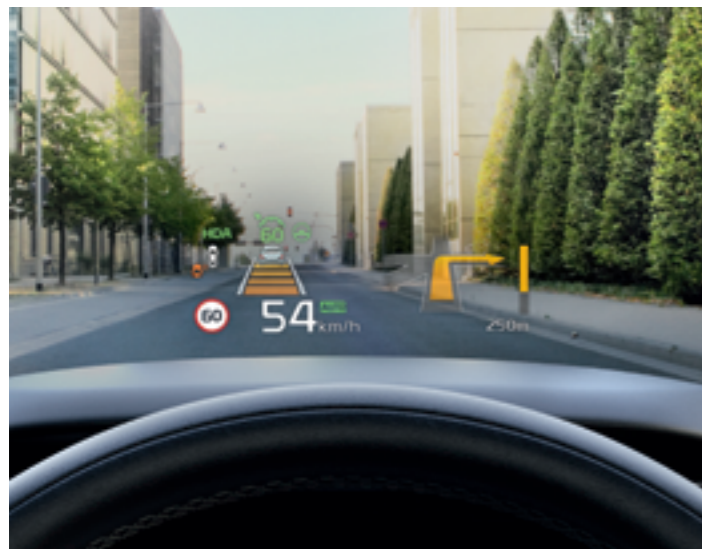
SZÉLVÉDŐRE VETÍTETT ADATOK (HUD)

Ha útra kel, jólesik az érzés, hogy azokat is kényelmes, tágas és ergonomikus környezet veszi körbe, akik Önnel tartanak.