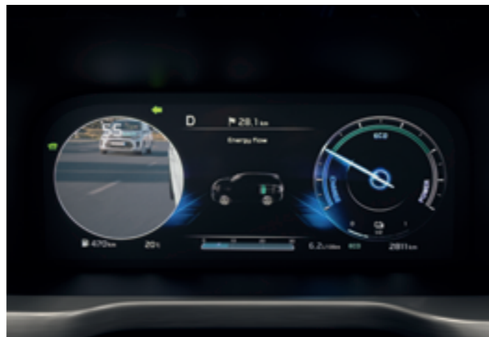
HOLTTÉRFIGYELŐ KAMERARENDSZER (BVM)

A BCA érzékeli, ha egy másik jármű bújik meg a holttérben. Ilyenkor a külső tükrön és a műszerfalán felvillan a veszélyt jelző ikon, továbbá jól hallható csipogás figyelmezteti a vezetőt. Amennyiben mégis megkezdje a sávváltást, a rendszer lefékezi az autót, hogy elkerülje az ütközést, a figyelmeztetőikonok pedig gyors villogásba kezdenek.