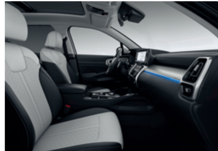
OPCIÓS, KÉTTÓNUSÚ, FEKETE-SZÜRKE BŐR