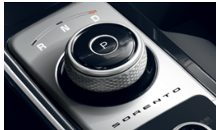
FORGÓKAPCSOLÓVAL VEZÉRELHETŐ SEBESSÉGVÁLTÓ

Az új automata váltó különféle üzemmódokban használható, így a vezető meghatározhatja, hogy az erőátvitel hogy reagáljon a gázadásokra. A maximális menetdinamika alacsony üzemanyag-fogyasztással is párosulhat, igazodva a felhasználó elvárásaihoz. A dízelmotor is képes az alkalmazkodásra, Eco, Comfort, Sport és Smart üzemmódban is használható, míg a hibrid Sorento Eco, Sport és Smart programot kínál. A DMS a szervokormány rásegítésének mértékét is szabályozza, villámgyors vagy lágy kormányreakciót eredményezve.