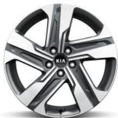
Dízel / HEV / PHEV 19" könnyűfém keréktárcsa