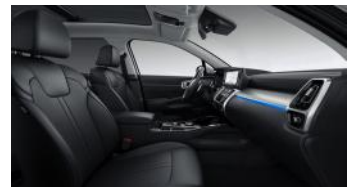
KRYPTONITE felár nélkül választható fekete bőr