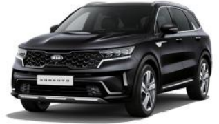
Aurora Black Pearl (ABP) METÁL