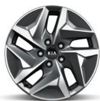
HEV 17" könnyűfém keréktárcsa