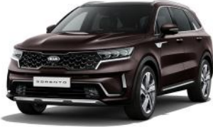
Essence Brown (BE2) PRÉMIUM METÁL