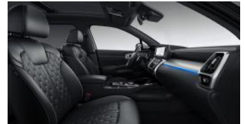
KRYPTONITE opciós fekete NAPPA bőr