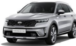
Silky Silver (4SS) METÁL