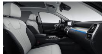
PLATINUM PRO opciós fekete/szürke kéttónusú bőr