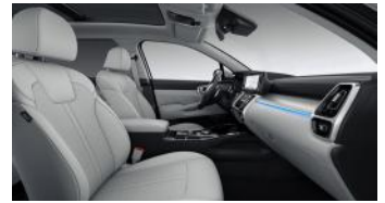
KRYPTONITE felár nélkül választható szürke bőr