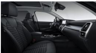
GOLD, PLATINUM, PLATINUM PRO sztenderd fekete szövet