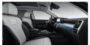
KRYPTONITE opciós fekete/szürke kéttónusú bőr