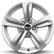
Dízel 17" könnyűfém keréktárcsa