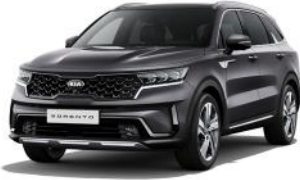
Platinum Graphite (ABT) METÁL