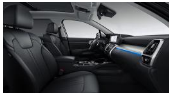
PLATINUM opciós fekete bőr