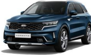
Gravity Blue (B4U) PRÉMIUM METÁL