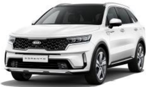
Snow White Pearl (SWP) PRÉMIUM METÁL