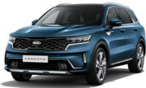
Mineral Blue (M4B) PRÉMIUM METÁL