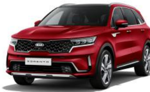
Runway Red (CR5) PRÉMIUM METÁL