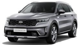
Steel Grey (KLG) METÁL