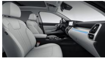
PLATINUM opciós szürke bőr