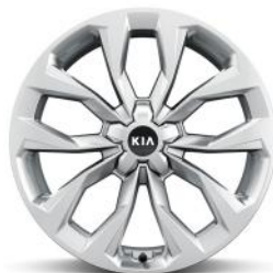
Dízel 20" könnyűfém keréktárcsa