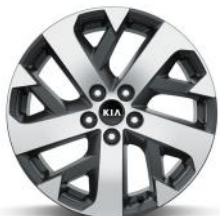
Dízel 18" könnyűfém keréktárcsa