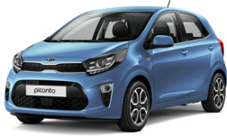
Alice Blue (ABB)