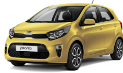
Honey Bee (B2Y)