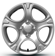
SILVER 14" acél keréktárcsa díztárcsával