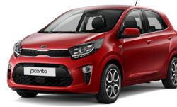
Shiny Red (A2R)