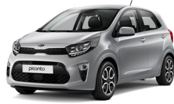
Sparkling Silver (KCS)