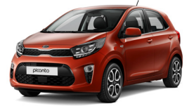
Pop Orange (G7A)