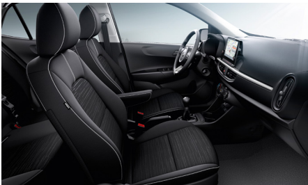
SILVER fekete szövet