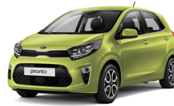
Lime Light (L2E)