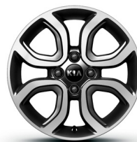
PLATINUM 15" könnyűfém keréktárcsa