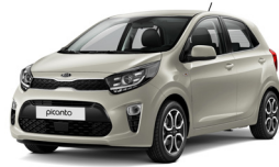
Milky Beige (M9Y)