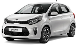
Clear White (UD)