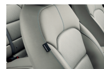
Szürke kéttónusú szövet (LX alapkitvel)