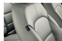
Szürke kéttónusú szövet-bőr (EX alapkitvel)