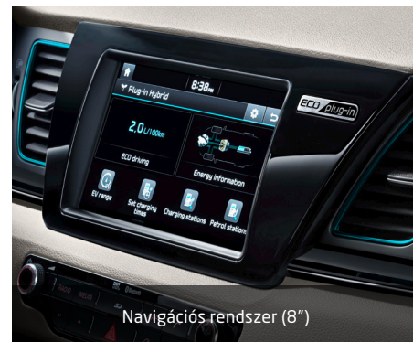
Navigációs rendszer (8")