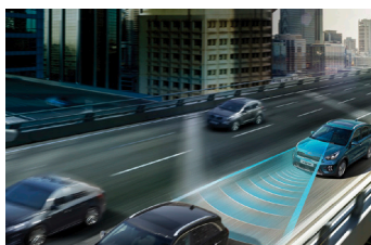
Ráfutásos ütközésselkerülő támogatás -autók, gyalogosok, kerékpárosok (FCA)