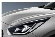
Silky Silver (4SS)