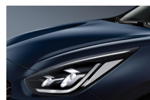
Gravity Blue (B4U)