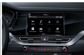
8" Multimédia egység tolatókamerával