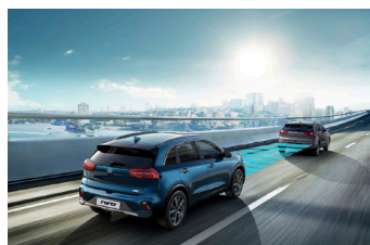
Adaptív tempomat Stop&Go funkcióval (SCC)