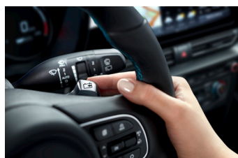
Fékezési energia visszanyerés