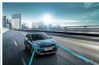
Sávkövető rendszer araszoló funkcióval (LFA)