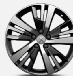
18"-os DETROIT könnyűfém, kéttonusú, gyémánt-matt fekete felni (GT Line változatnál széria)