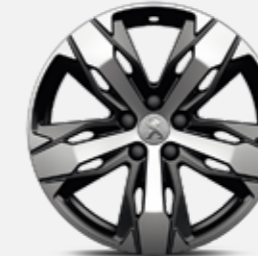
18"-os LOS ANGELES könnyűfém, kéttonusú, gyémánthatású felni (Grip Control esetén)