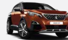
Réz Cuprite/Fekete Perla Nera*