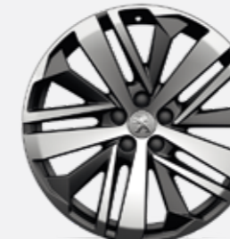
19"-os BOSTON könnyűfém, kéttonusú, gyémánthatású felni (GT változathoz széria)