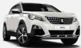
Gyöngyház Fehér Nacré