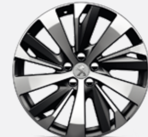
19"-os NEW YORK könnyűfém, kéttonusú, gyémánthatású felni (GT változathoz rendelhető)