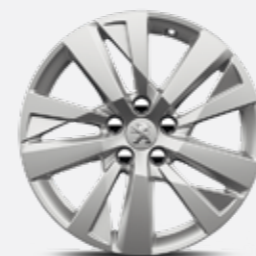
17"-os CHICAGO könnyűfém felni (széria Active)