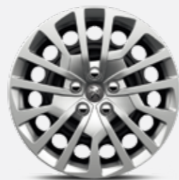
17"-os lemezfelni MIAMI dísztárcsával (széria Access)

Tegye fel az i-re a pontot: válasszon a 17, 18, illetve 19 colos, nyolcféle keréktárcsa közül.