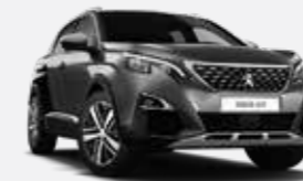
Szürke Platinum/Fekete Perla Nera*