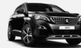
Fekete Perla Nera