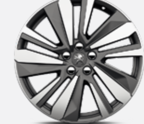
19"-os WASHINGTON könnyűfém, kéttonusú, gyémánthatású felni (opció Allure)