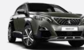
Szürke Amazonit/Fekete Perla Nera*