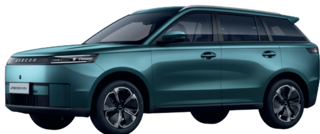
ALPESI ZÖLD (LQ)