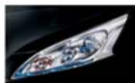
Fekete (M) GN0