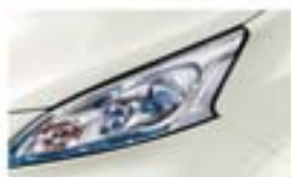
Gyöngyházfehér (GY) QAB