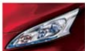
Piros (S) Z10