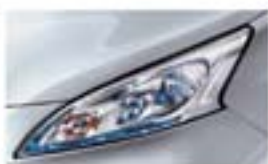
Ezüst (M) KLO