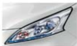
Fehér (S) QM1