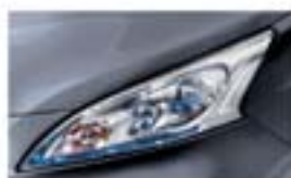
Szürke (M) K51