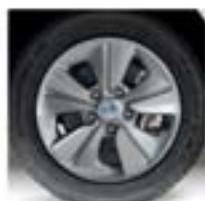
15" Könnyűfém keréktárcsa