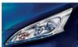
Kék (GY) BW9