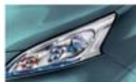
Türkizkék (M, GY) RBM